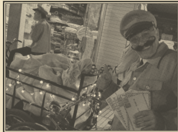
Espectáculo itinerante desde Villa Elisa hasta Villa Ana. Sábado 2 a las 18:00 h y domingo 3 a las 20:00 h.

En una época donde muy pocas personas escriben cartas, estos incansables y antiguos carteros se han propuesto que los vecinos de Las Villas se escriban cartas entre sí mismos, reciban las de algún anónimo o sean los destinatarios de premios, certificados y telegramas. Así, se trata de un espectáculo itinerante y de participación directa con el público. Su único objetivo es que todos aquellos que sepan utilizar un lápiz puedan enviarle un mensaje a cualquier otra persona que en ese momento esté en el paseo. No es necesario un nombre ni una dirección concreta porque la carta siempre llegará a su destino. Los carteros y carteras se encargarán de todo y siempre encontrarán a las personas que hayan sido afortunadas. Esta es una propuesta de la Compañía Insolits Performing Arts y dirigida por Luis Miguel Pardo.