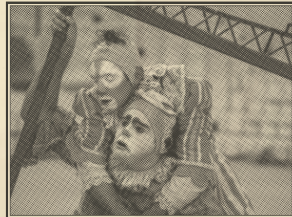
Espectáculo frente a Villa María. Viernes 1 a las 22:30 h.

El Gran Final es una tragicomedia que basa su esencia en el reencuentro de dos payasos, los cuales tuvieron que separarse hace muchos años a consecuencia del estallido de una guerra civil. Esta guerra les interrumpe la última función justo antes de su gran acto final. Y así, el conflicto les obliga a tomar caminos separados y no volver a tener contacto el uno con el otro. Ahora, después de 30 años e infinitos pasos, una lucha diaria y constante por la supervivencia, se reencontrarán y decidirán terminar su "Gran Final". Se trata, en definitiva, de un homenaje a uno de los oficios más bonitos y generosos del mundo: el oficio de ser payaso. Sentir, para crear un diálogo con el espectador desde las emociones donde sobran las palabras. Un imaginario colectivo que payasos de todos los tiempos nos han dejado en la memoria.