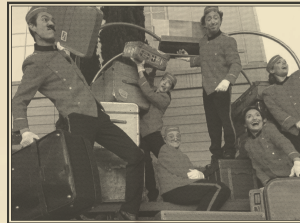
Espectáculo itinerante desde Villa Elisa hasta Villa Ana. Sábado 2 a las 20:00 h y domingo 3 a las 18:00 h.

Bienvenidos al Hotel Insolits. Estamos orgullosos de ofrecerles una estancia sin precedentes. Relájense y déjense llevar por la profesionalidad de nuestro personal formado en las mejores escuelas internacionales. Clase, eficacia y elegancia son nuestros pilares. Estamos siempre a su servicio para hacerles pasar una velada de ensueño. Nuestro lema: cuando suena el cascabel, abrimos nuestro hotel. Espectáculo para todos los públicos, cómico e itinerante, formado por cinco artistas y un gran carro porta equipajes con música y luces. En el recorrido se presentan diferentes situaciones donde el público participa descubriendo las habilidades de estos cinco trabajadores de un antiguo hotel: coreografías de baile, concierto musical, juegos para encontrar las maletas de los huéspedes o la elección del cliente del mes.