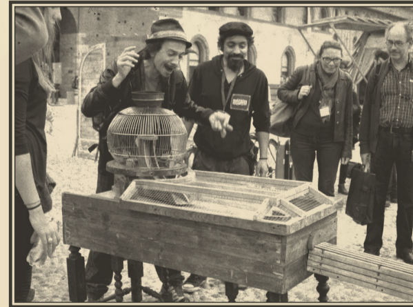
Experiencias para niños/as frente a Villa Amparo. Viernes 1, sábado 2 y domingo 3 de 18:00 h a 21:00 h.

La vida del Señor Tonet es fascinante. Sus aventuras son un tesoro por descubrir. Desde que conocimos su historia, no hemos podido dejar de pensar en él y en sus viajes. Por ello, queremos compartir sus hallazgos y todas las criaturas que descubrió en sus expediciones. Y así, las hemos guardado en el interior de varios juegos contruidos con materiales en desuso. Cada juego, en una caja. Y en cada caja, una historia nueva. Este es el proyecto de Tombs Creatius, una compañía de artes de calle que propone experiencias para mantener despierta la criatura que todos llevamos dentro. Así, sus artífices creen en el arte como una chispa para despertar inquietudes, para sacudir las mentes y para hacer latir los corazones. Por ello, trabajan con propuestas que generen experiencias colectivas, que nos hagan sentir, mirar y jugar.