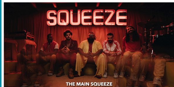
THE MAIN SQUEEZE

Recuerda: Market de vinilos por "José Mercadillo" en Plaza Constitución (del 2 al 4 de junio de 2023).