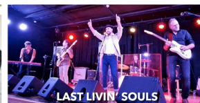
LAST LIVIN' SOULS