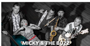
MICKY & THE BUZZ