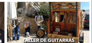
TALLER DE GUITARRAS