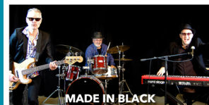
MADE IN BLACK