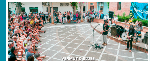
VERMUT & BLUES