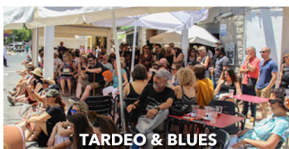
TARDEO & BLUES