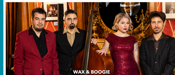
WAX & BOOGIE