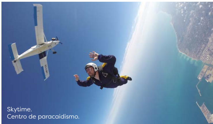
Skytime. Centro de paracaidismo.