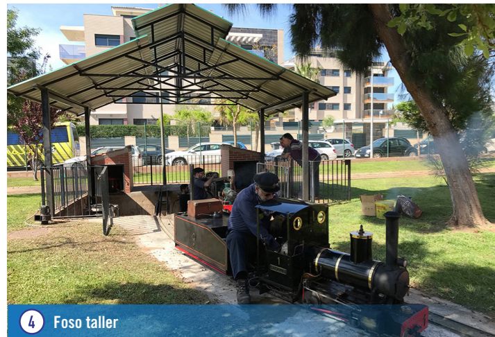
4 Foso taller