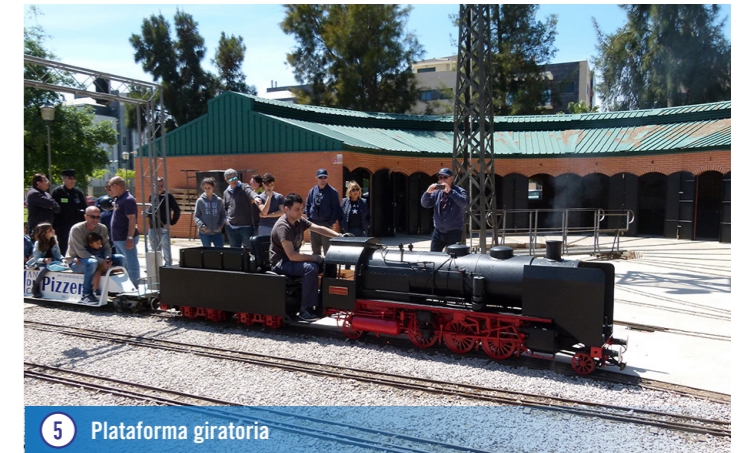
5 Plataforma giratoria