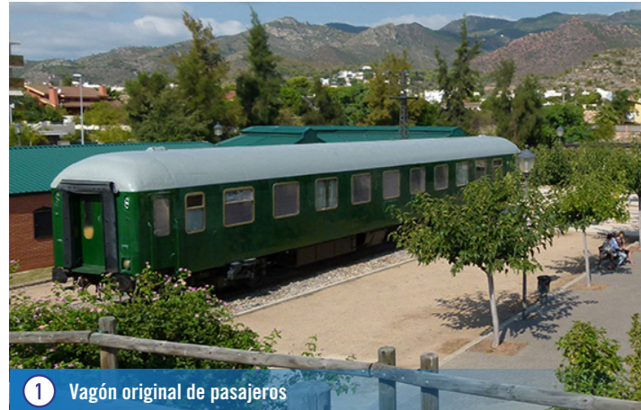
1 Vagón original de pasajeros