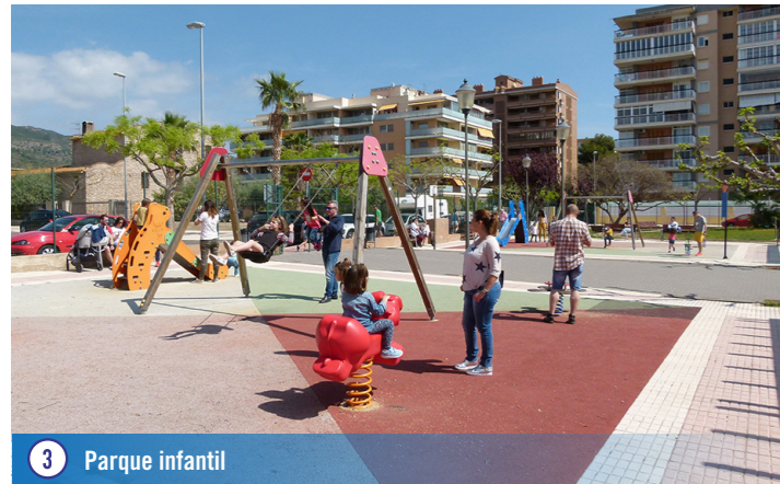
3 Parque infantil