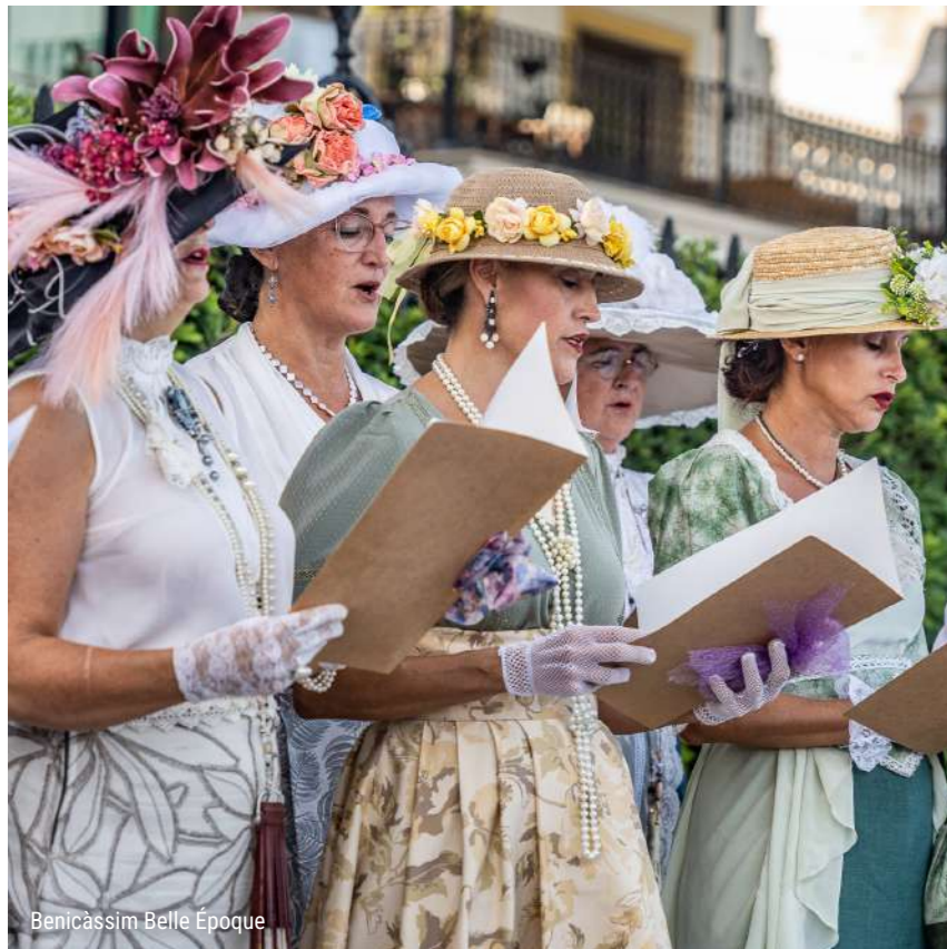
Benicàssim Belle Époque

artesanía y oficios tradicionales, exposiciones de época, concursos, actuaciones musicales, representaciones teatrales y muchas sorpresas más. Una experiencia única para sumergirse en la historia y el patrimonio de Benicàssim.