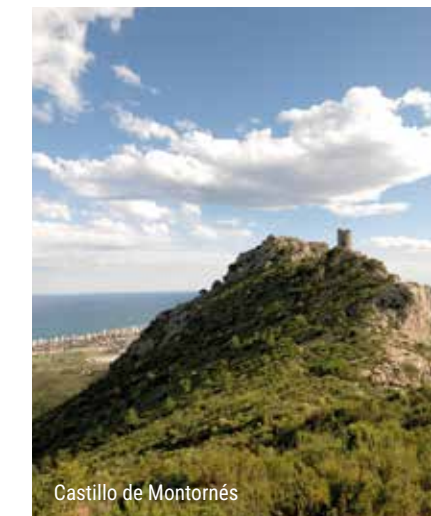
Castillo de Montornés