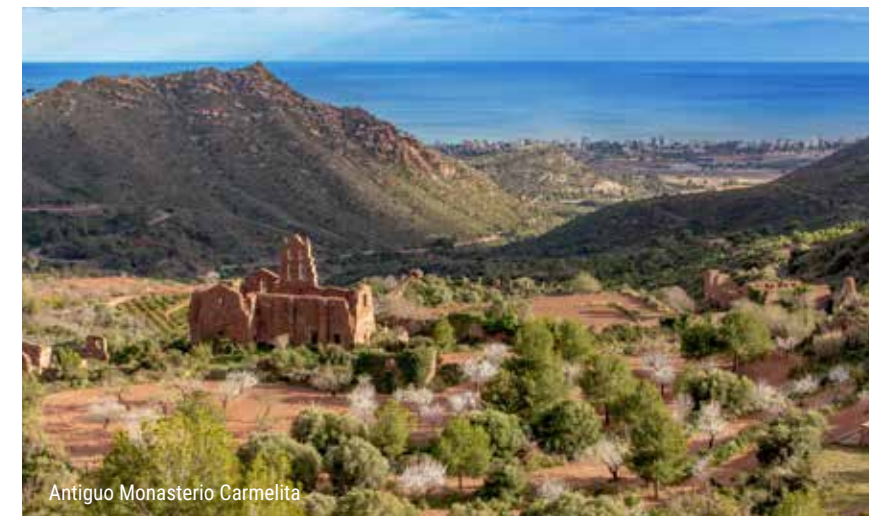
Antiguo Monasterio Carmelita