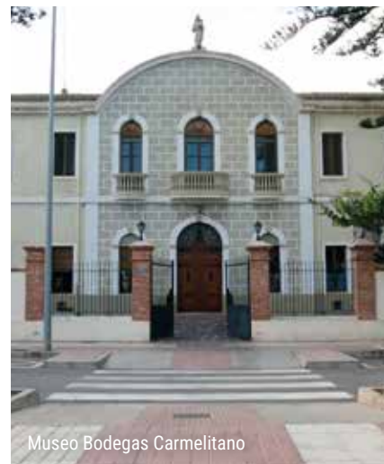
Museo Bodegas Carmelitano