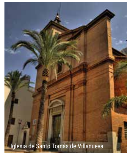
Iglesia de Santo Tomás de Villanueva