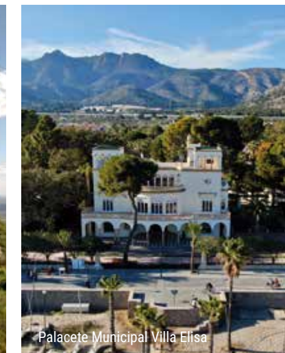
Palacete Municipal Villa Elisa