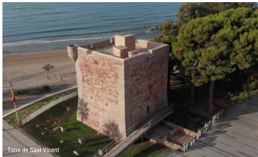
Torre de Sant Vicent

En los tiempos de la Belle Époque, un selecto grupo de familias adineradas castellonenses y valencianas eligieron a Benicàssim como residencia estival, creando lo que hoy en día se conoce como el "Biarritz valenciano", un conjunto de villas de gran riqueza arquitectónica, que te harán viajar en el tiempo.