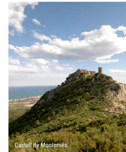
Castell de Montornés