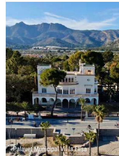
Palauet Municipal Vil·la Elisa