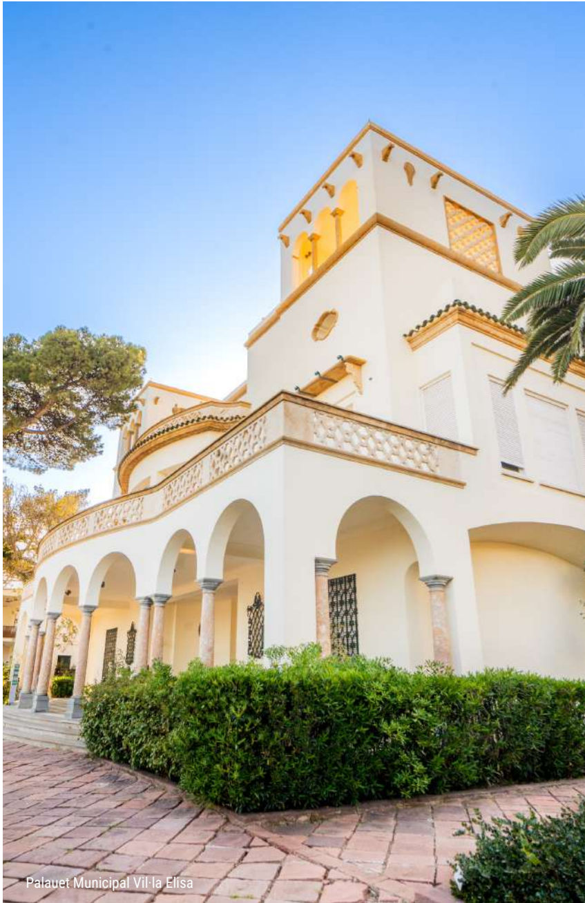
Palauet Municipal Vil·la Elisa

Des dels seus orígens àrabs a les agitades festes de les seues vil·les modernistes. Deixa't sorprendre per la història de Benicàssim.