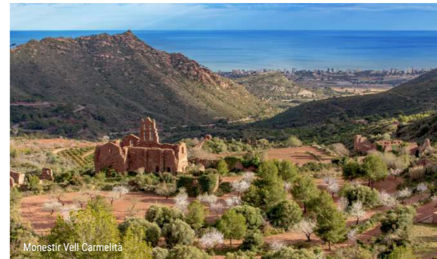
Monestir Vell Carmelità