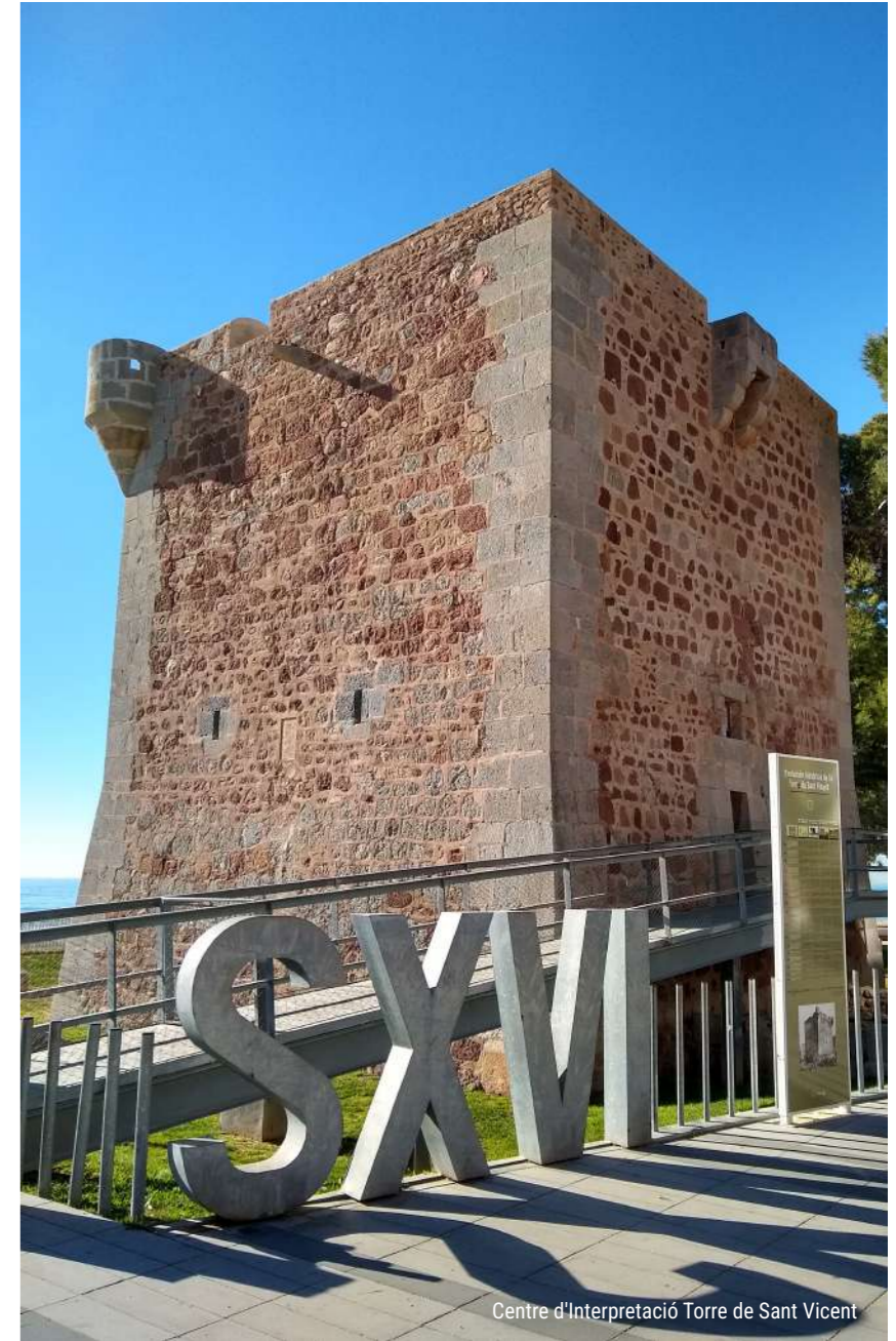
Centre d'Interpretació Torre de Sant Vicent

Descobreix els llocs més emblemàtics de la nostra ciutat. La millor manera de viatjar en el temps i submergir-te en el seu interessant passat.