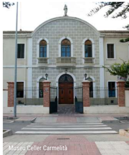
Museu Celler Carmelità