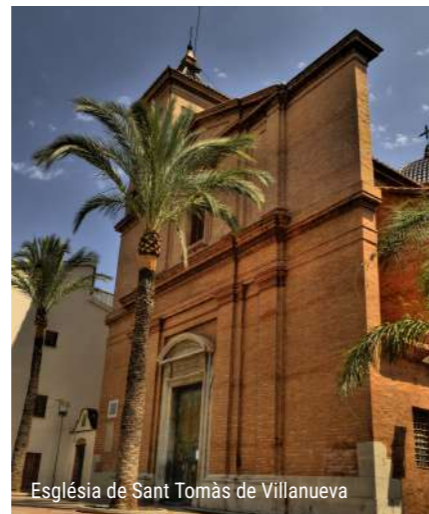
Església de Sant Tomàs de Villanueva