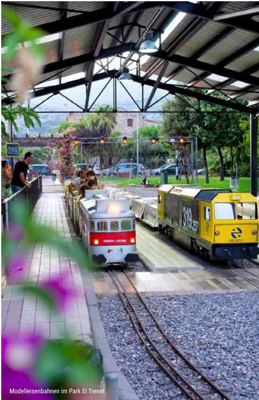
Modelleisenbahnen im Park El Trenet

Im Sommer bietet der Park El Trenet ein einzigartiges Programm, das Sie sich nicht entgehen lassen sollten.