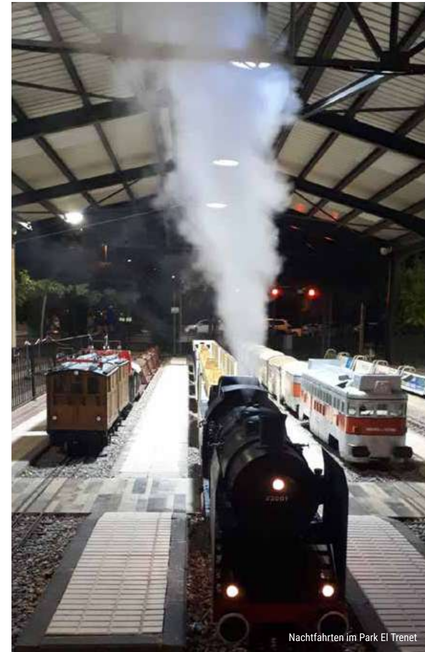
Nachtfahrten im Park El Trenet

Genießen Sie besondere Fahrten in den Sommerabenden und unternehmen Sie eine Zugreise in die Mondlicht.