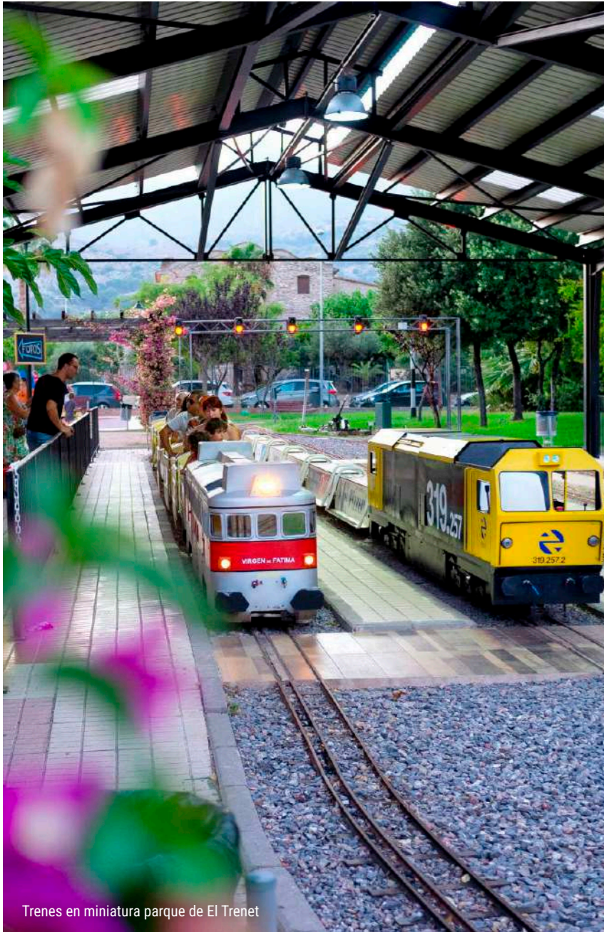
Trenes en miniatura parque de El Trenet

Durante el verano el parque de El Trenet tiene una programación única que no te puedes perder.