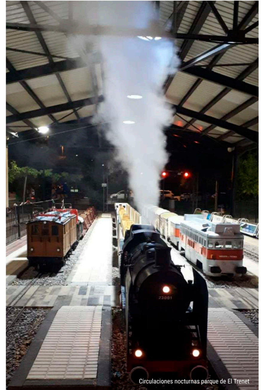
Circulaciones nocturnas parque de El Trenet

Disfruta de unas circulaciones especiales durante las noches de verano y haz un viaje en tren a la luz de la luna.