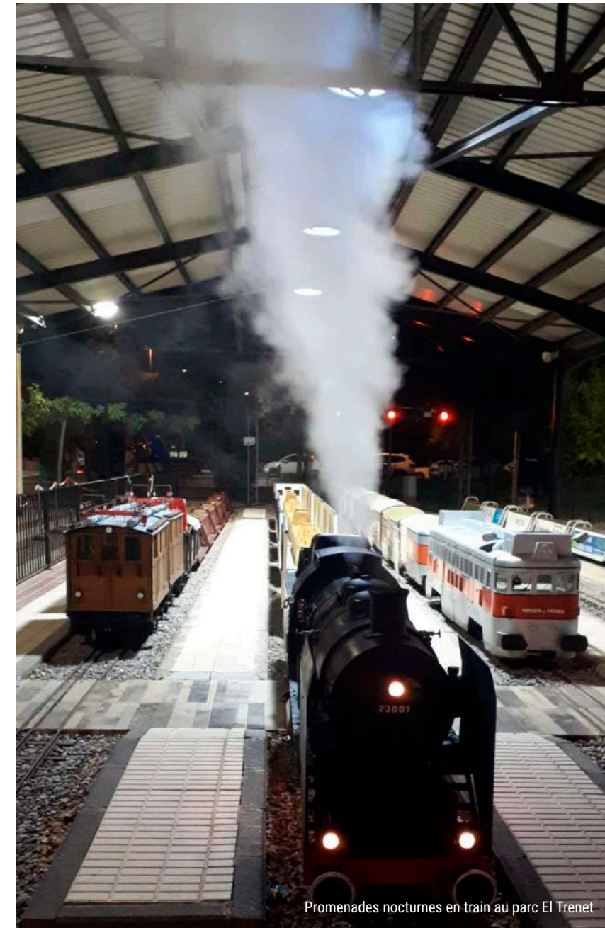
Promenades nocturnes en train au parc El Trenet

Profitez des circulations spéciales pendant les nuits d'été et faites un tour en train au clair de lune.