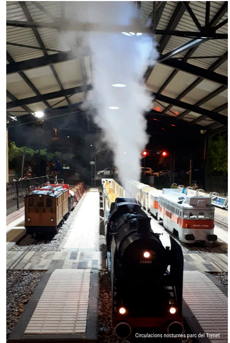
Circulacions nocturnes parc del Trenet

Gaudix d'unes circulacions especials durant les nits d'estiu i fes un viatge amb tren a la llum de la lluna.