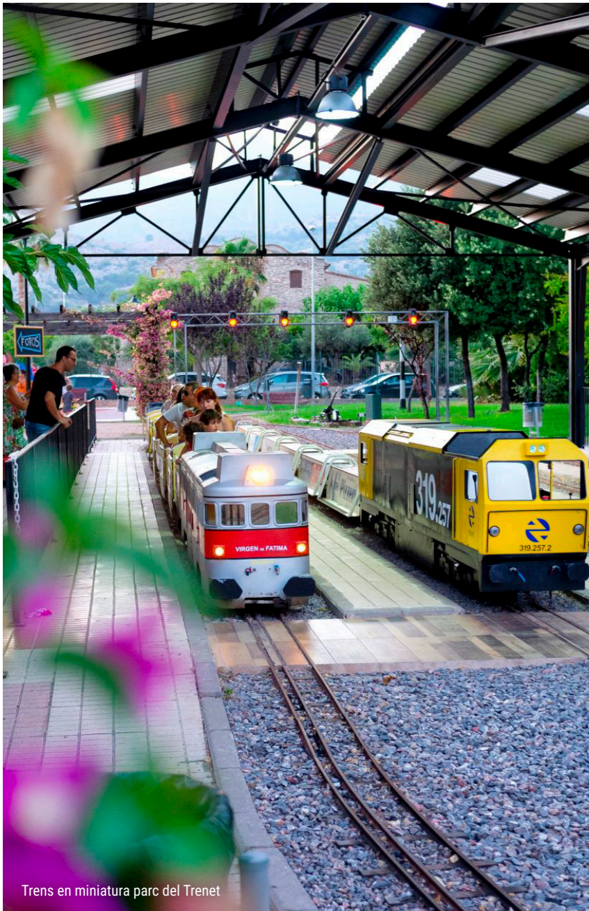
Trens en miniatura parc del Trenet

Durant l'estiu el parc del Trenet té una programació única que no et pots perdre.