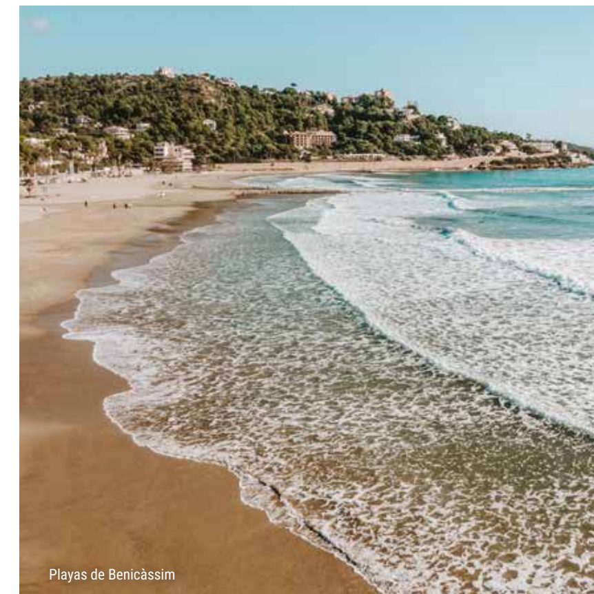
Playas de Benicàssim

Son cultura cuando visitas las bibliotecas del mar y dejas volar la imaginación mientras te sumerges en tu libro preferido, escuchando el rumor del mar.