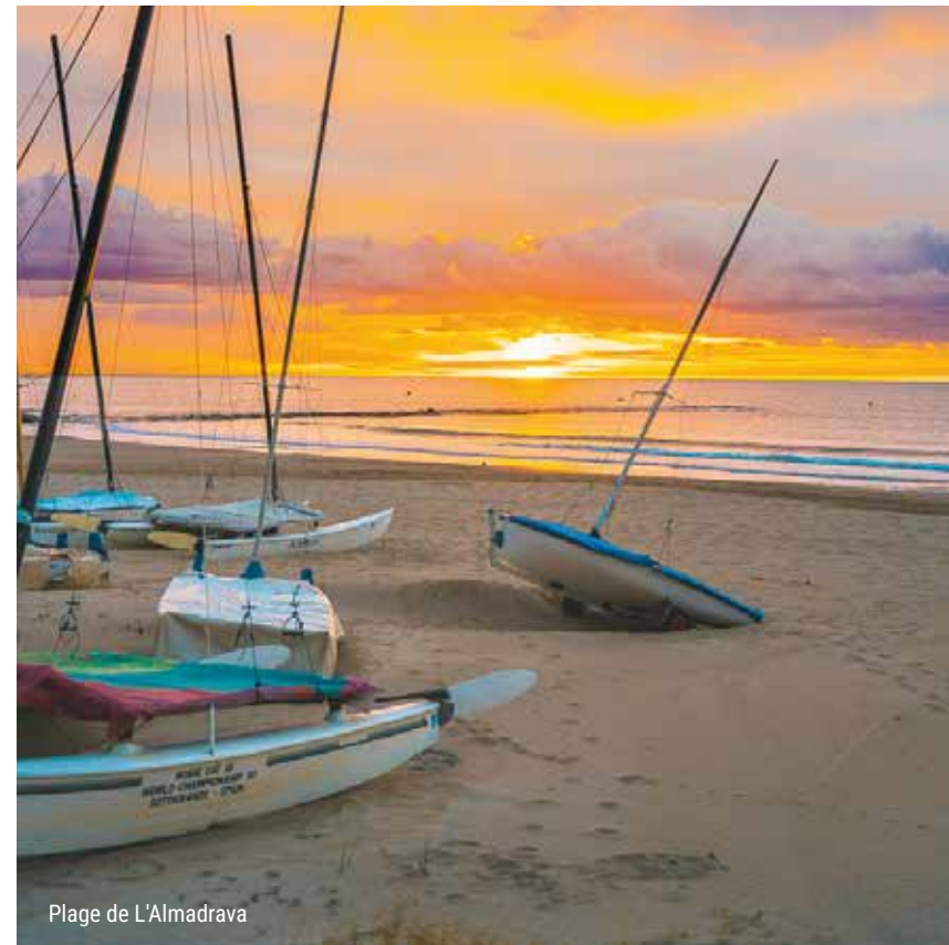
Plage de L'Almadrava

Les plages de Benicàssim disposent d'accès et de passerelles adaptées. Les plages d'Heliópolis, d'Els Terrers, de La Torre de Sant Vicent, de L'Almadrava et de Voramar disposent d'un service de baignade assistée, douches accessibles, chaises amphibies et grue.