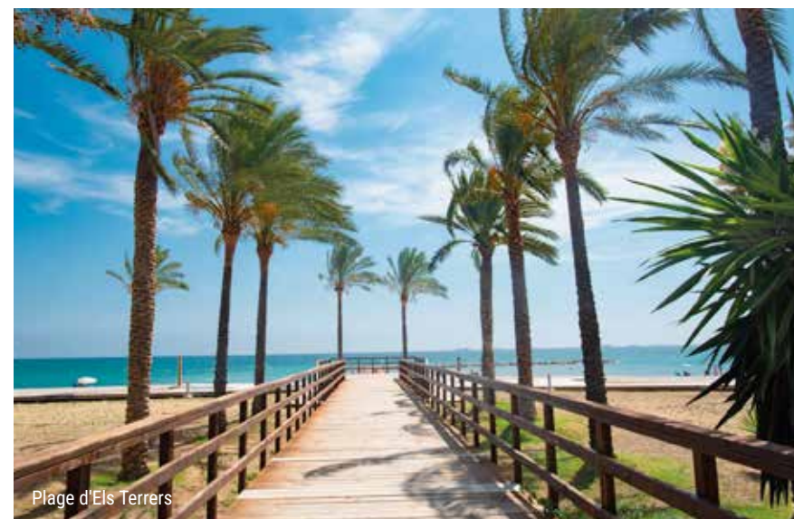
Plage d'els Terrers