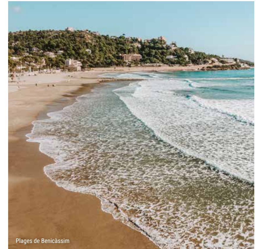
Plages de Benicàssim

Elles sont la culture lorsque vous visitez les bibliothèques de la mer et laissez libre cours à votre imagination en vous plongeant dans votre livre préféré, en écoutant le bruit de la mer.