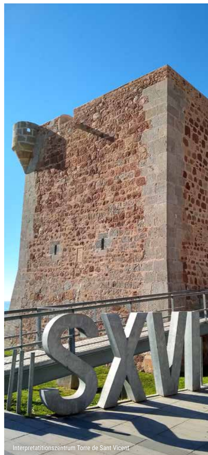
Interpretationszentrum Torre de Sant Vicent