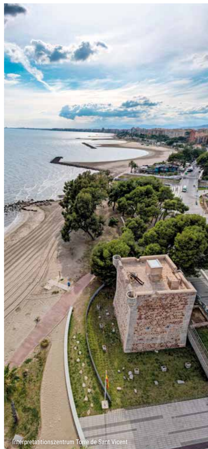
Interpretationszentrum Torre de Sant Vicent