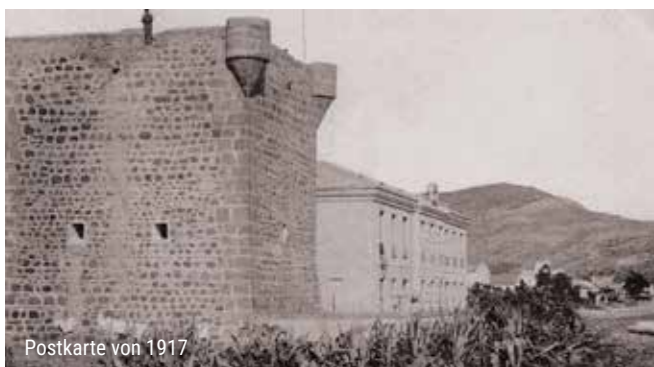
Postkarte von 1917

Der Turm, der bereits seit mindestens 1607 unter dem Namen „Sanct Vicente“ dokumentiert ist, war mit einer Garnison von fünf Männern besetzt: einem Alcaide, zwei Soldaten, die den Turm beaufsichtigten, und zwei Treibern. Sie war mit Schusswaffen und einer Artillerie ausgestattet, was ihre Verteidigungsfähigkeit stärkte.