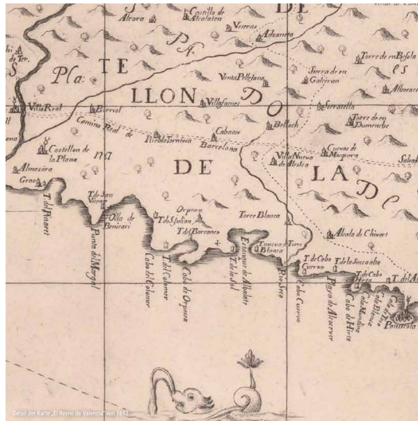
Detail der Karte „El Reyno de Valencia“ von 1693