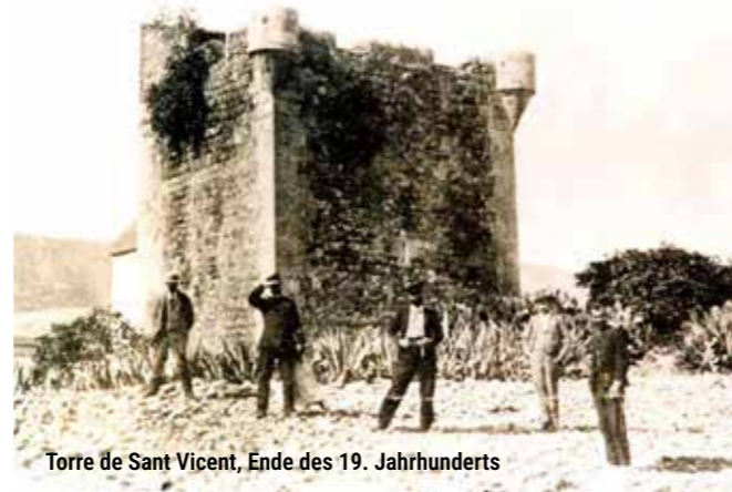
Torre de Sant Vicent, Ende des 19. Jahrhunderts