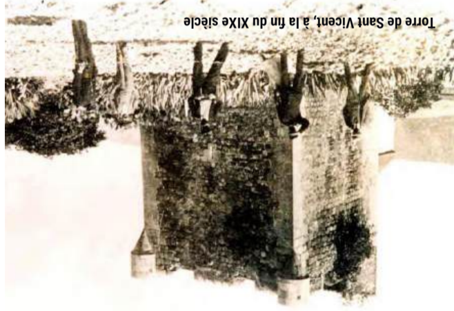
Torre de Sant Vicent, à la fin du XIXe siècle

Sa construction est mentionnée dans les Cortes de Monzón de 1547 et documentée dans le Discours d'Antoine de 1563. Bien que la date exacte ne soit pas connue, elle aurait été bâtie entre 1553 et 1558. Des 1850, elle était déjà décrite comme en ruines, et elle disparut complètement au milieu du XIXe siècle.