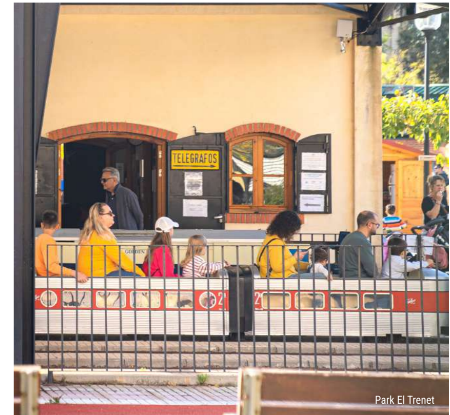
Park El Trenet

Darüber hinaus sind die Go-Karts und die Bowlingbahn perfekte Optionen, um aufregende und lustige Momente zu genießen, die für alle Altersgruppen und Niveaus geeignet sind. Mit diesen und vielen weiteren Alternativen garantiert Benicàssim unterhaltsame und abwechslungsreiche Pläne, damit sich die ganze Familie während ihres Aufenthalts amüsieren und unvergessliche Erinnerungen schaffen kann.