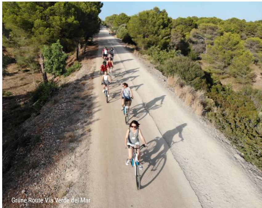
Grüne Route Vía Verde del Mar

Für die Abenteuerlustigsten bietet die Desert de les Palmes ein Netz von Wanderwegen, die perfekt für Familien sind, mit Routen unterschiedlicher Schwierigkeitsgrade. Die Wege sind gut markiert und führen durch Landschaften von großem ökologischen Wert, mit mediterraner Vegetation und Rastplätzen, die ideal für eine Pause mit Kindern sind. Es ist eine sichere und lehrreiche Option, um die Natur mit der Familie zu genießen. An diesem Ort befindet sich das Interpretationszentrum von La Bartola, in dem Informationen und Erläuterungstafeln über die Geschichte, die Fauna und die Flora dieses Naturgebiets angeboten werden.