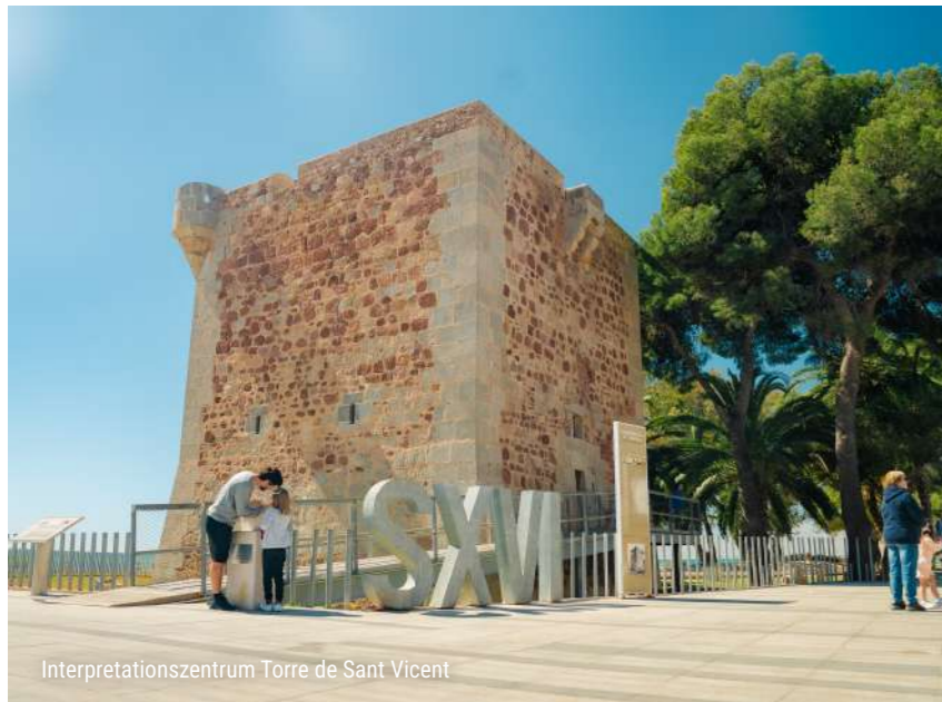
Interpretationszentrum Torre de Sant Vicent

Auch das religiöse Erbe bietet interessante Vorschläge, wie die Kirche Santo Tomás de Villanueva und das Kloster Desert de les Palmes . Letzteres, inmitten der Natur gelegen, ermöglicht es, Kultur und Wandern in einem idealen Erlebnis für Familien zu verbinden. Die Kleinen können Ruinen voller Geschichte erkunden und dabei etwas über das Klosterleben und die umgebende Natur lernen, in einem Plan, der Bildung, Spaß und Natur vereint.