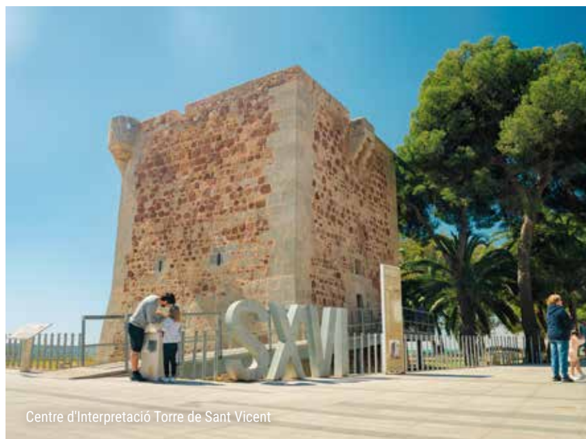
Centre d'Interpretació Torre de Sant Vicent

El patrimonio religioso también ofrece propuestas interesantes, como la iglesia de Santo Tomás de Villanueva y el monasterio del Desert de les Palmes . Este último, situado en plena naturaleza, permite combinar cultura y senderismo en una experiencia ideal para familias. Los más pequeños pueden explorar ruinas llenas de historia mientras aprenden sobre la vida monástica y el entorno natural que lo rodea, en un plan que une educación, diversión y aire libre.