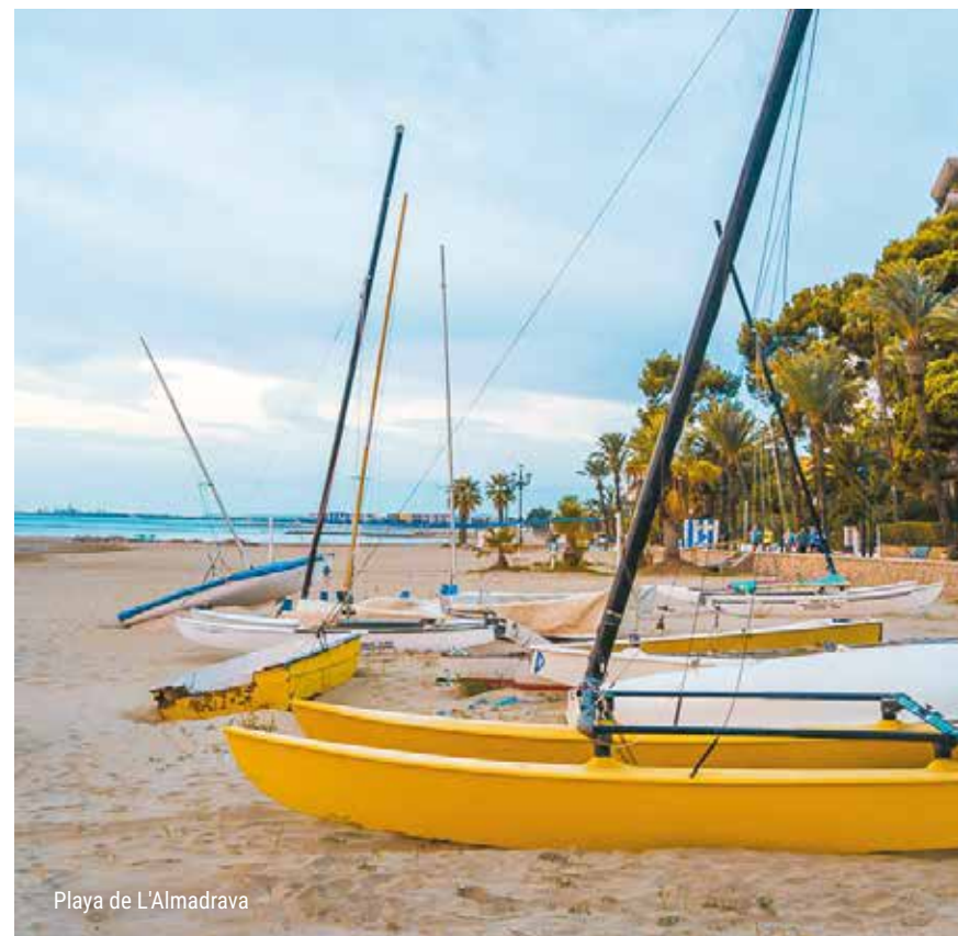
Playa de L'Almadrava

Benicàssim cuenta con una línea de playas de más de seis kilómetros, que alberga cinco grandes arenales dotados de instalaciones preparadas para el disfrute familiar. Todas ellas están galardonadas con el distintivo de Bandera Azul y la certificación medioambiental, lo que las hace especialmente seguras y aptas para el baño. Además, tres de ellas poseen la Q de calidad Turística y desde Voramar hasta Heliòpolis se puede disfrutar de zonas para el baño adaptado y accesible.