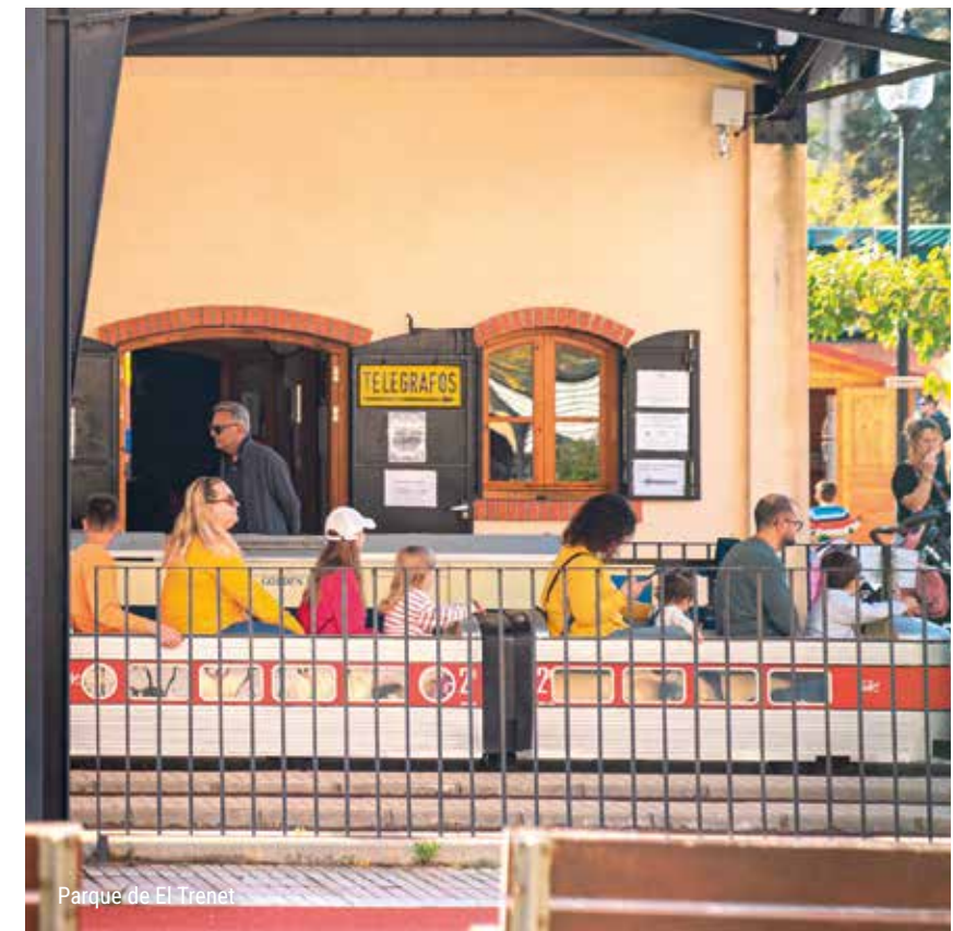
Parque de El Trenet

Además, los karts y la bolera son opciones perfectas para disfrutar momentos llenos de emoción y risas, adecuadas para todas las edades y niveles. Con estas y muchas otras alternativas, Benicàssim garantiza planes entretenidos y variados para que toda la familia pueda divertirse y crear recuerdos inolvidables durante su estancia.