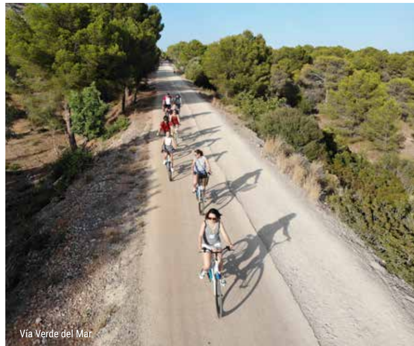
Vía Verde del Mar

Para los más aventureros, el Desert de les Palmes ofrece una red de rutas de senderismo perfectas para familias, con itinerarios de diferentes niveles de dificultad. Los caminos están bien señalizados y atraviesan paisajes de gran valor ecológico, con vegetación mediterránea y áreas de descanso ideales para hacer una parada con niños. Es una opción segura y educativa para disfrutar del aire libre en familia. En este paraje se encuentra el centro de Interpretación de la Bartola donde se ofrece información y paneles explicativos sobre la historia, la fauna y la flora de este enclave natural.