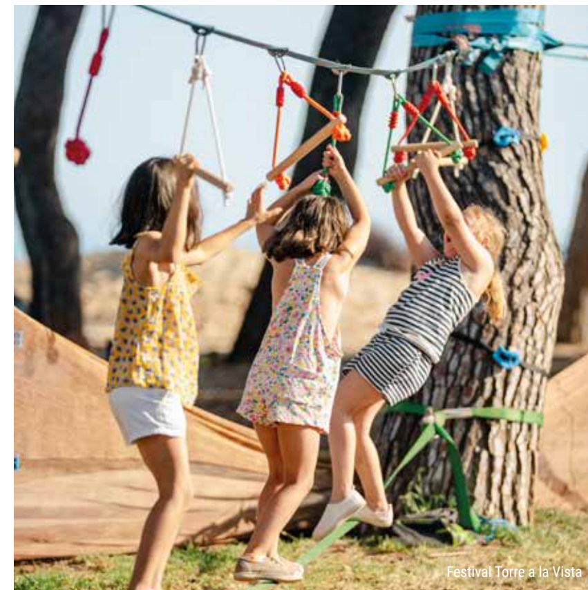
Festival Torre a la Vista

En Benicàssim, cada día es una nueva oportunidad para crear recuerdos inolvidables en familia. Ya sea practicando deportes acuáticos, descubriendo la historia local o simplemente relajándose frente al mar, el destino combina tranquilidad, diversión y servicios de calidad para que tus vacaciones familiares sean perfectas.