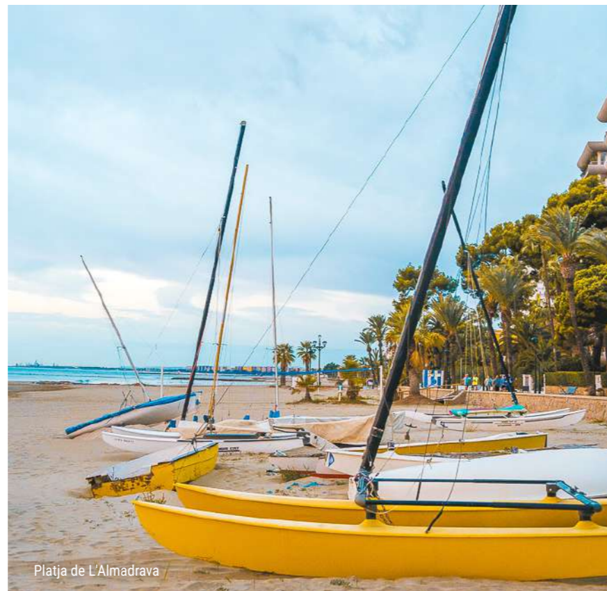
Platja de L'Almadrava