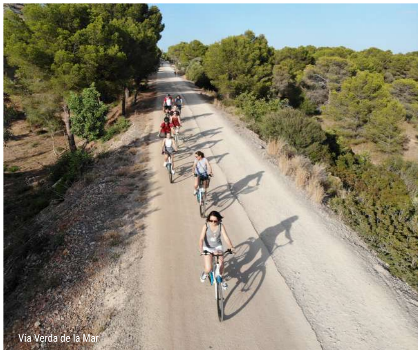
Via Verda de la Mar

Per als més aventurers, el Desert de les Palmes ofereix una xarxa de rutes de senderisme perfectes per a famílies, amb itineraris de diferents nivells de dificultat. Els camins estan ben senyalitzats i travessen paisatges de gran valor ecològic, amb vegetació mediterrània i àrees de descans ideals per a fer una parada amb xiquets. És una opció segura i educativa per a gaudir de l'aire lliure en família. En aquest paratge es troba el centre d'interpretació de la Bartola, on s'ofereix informació i panells explicatius sobre la història, la fauna i la flora d'aquest enclavament natural.