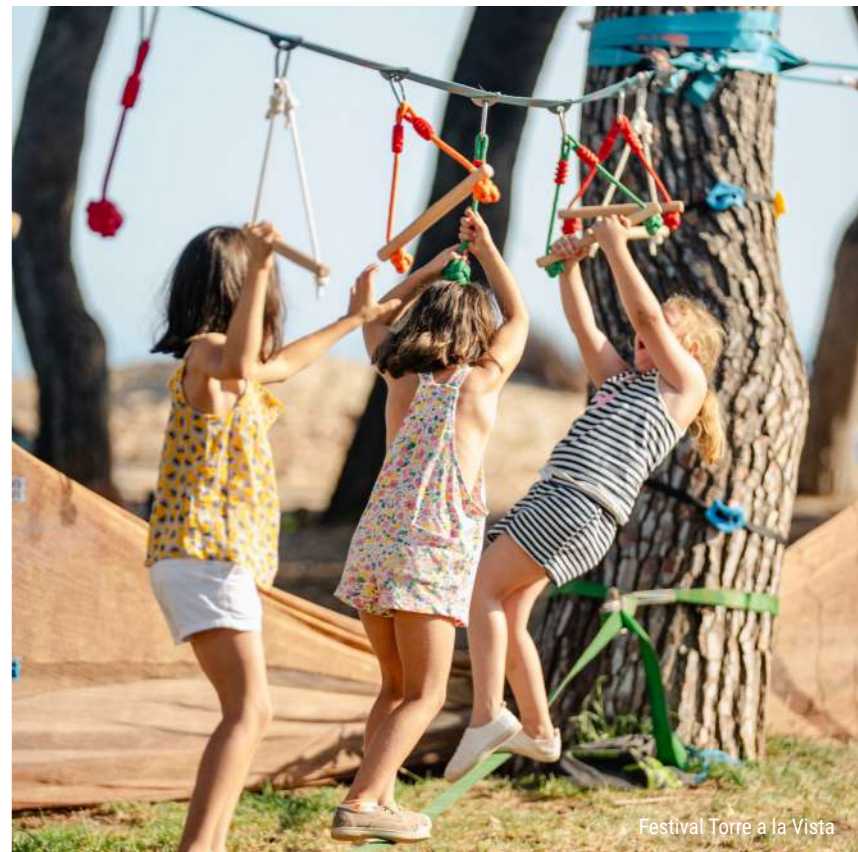
Festival Torre a la Vista

A Benicàssim, cada dia és una nova oportunitat per a crear records inoblidables en família. Ja siga practicant esports aquàtics, descobrint la història local o simplement relaxant-se davant de la mar, la destinació combina tranquil·litat, diversió i serveis de qualitat perquè les teues vacances familiars siguen perfectes.