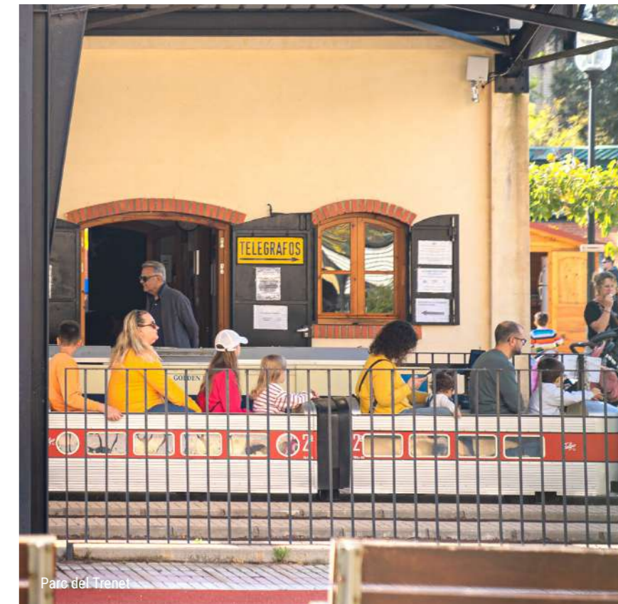
Parc del Trenet

A més, els karts i la bolera són opcions perfectes per a gaudir de moments plens d'emoció i riures, adequades per a totes les edats i nivells. Amb aquestes i moltes altres alternatives, Benicàssim garanteix plans entretinguts i variats perquè tota la família puga divertir-se i crear records inoblidables durant la seua estada.