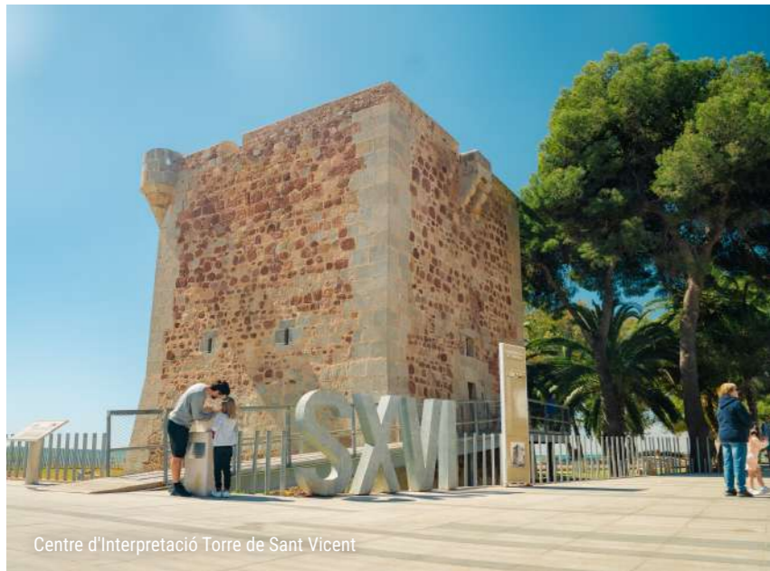
Centre d'interpretació Torre de Sant Vicent

El patrimoni religiós també ofereix propostes interessants, com l'església de Sant Tomàs de Villanueva i el monestir del Desert de les Palmes . Aquest últim, situat en plena natura, permet combinar cultura i senderisme en una experiència ideal per a famílies. Els més xicotets poden explorar ruïnes plenes d'història mentre aprenen sobre la vida monàstica i l'entorn natural que l'envolta, en un pla que uneix educació, diversió i aire lliure.