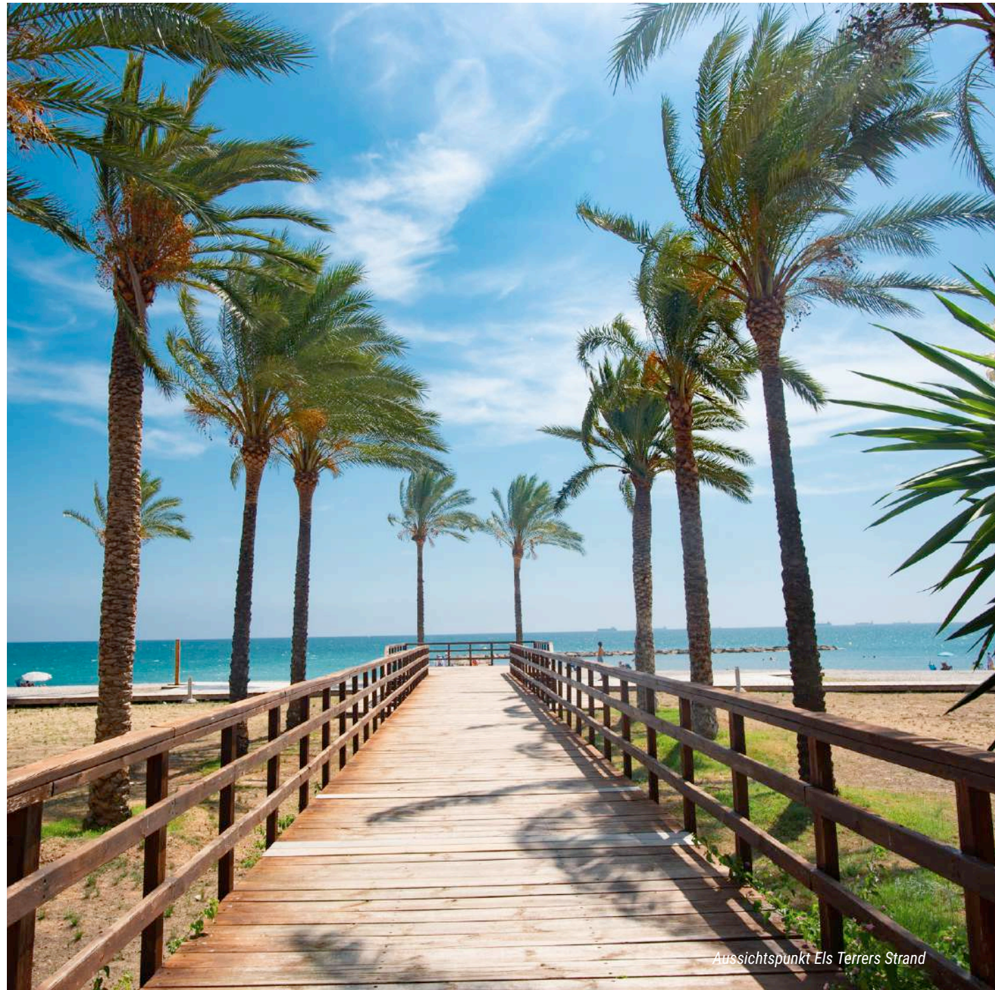
Aussichtspunkt Els Terrers Strand

Genießen Sie die Sonne und unsere Strände, indem Sie am Meer spazieren gehen