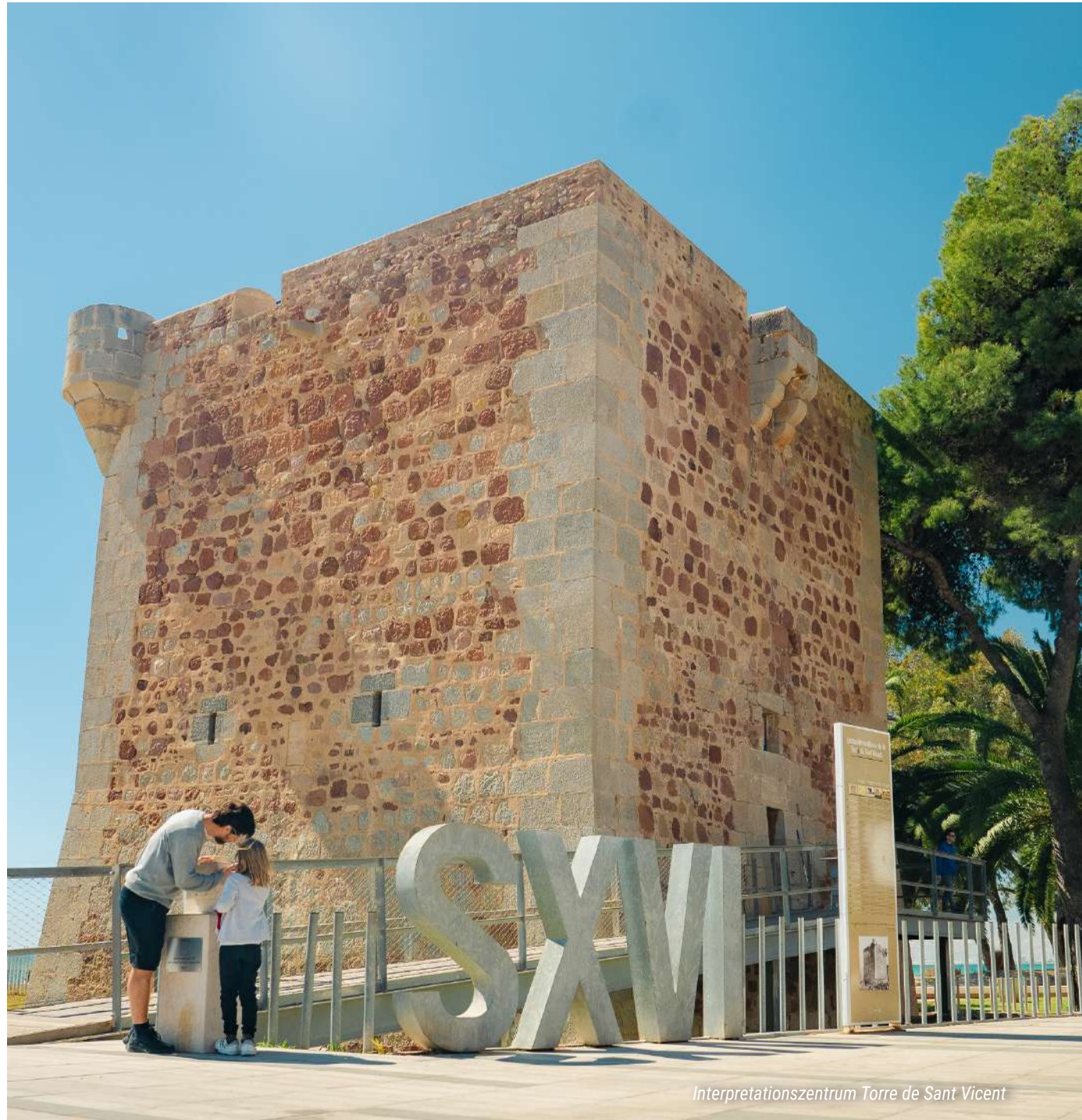
Interpretationszentrum Torre de Sant Vicent

Torre de Sant Vicent: Zeugin der Vergangenheit