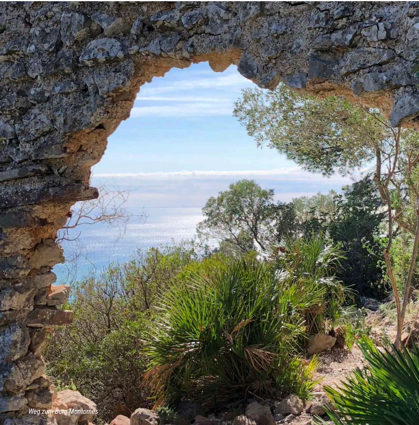
Weg zum Burg Montornés