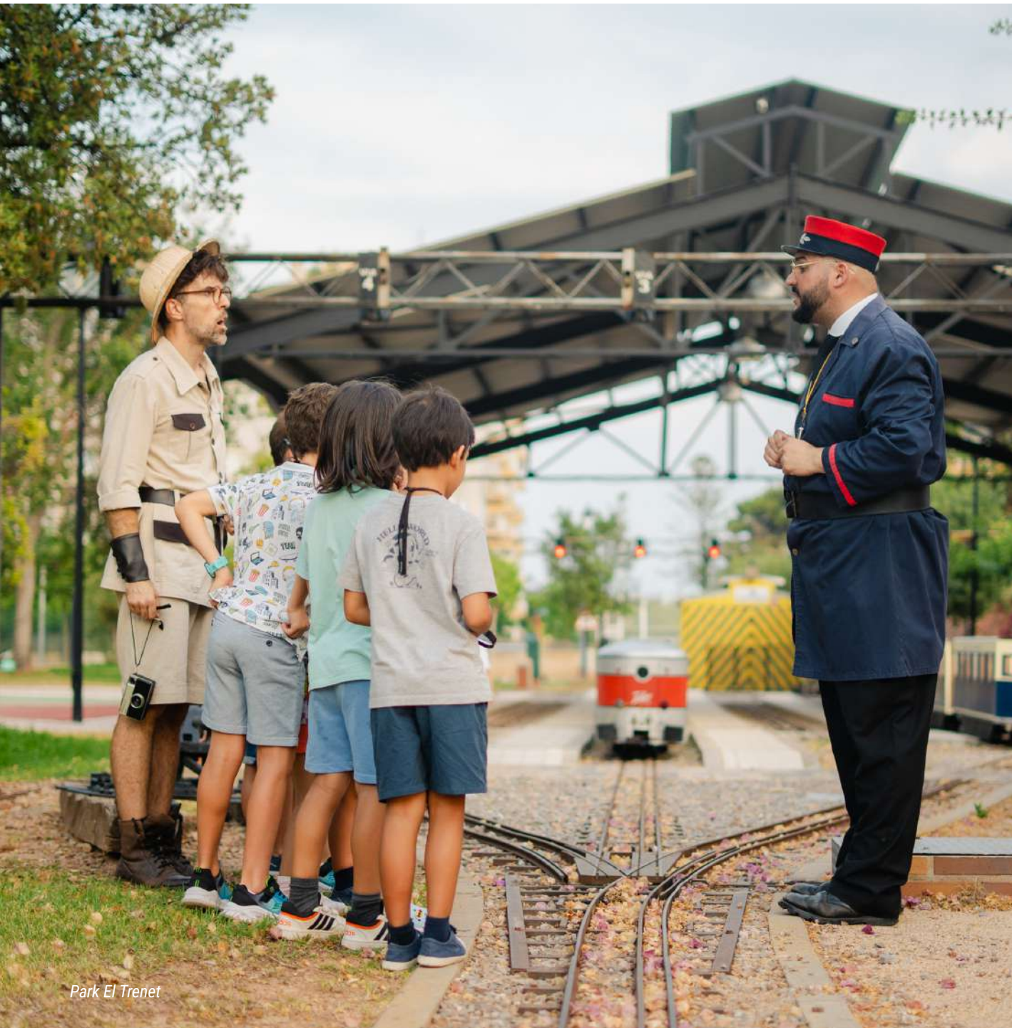
Park El Trenet