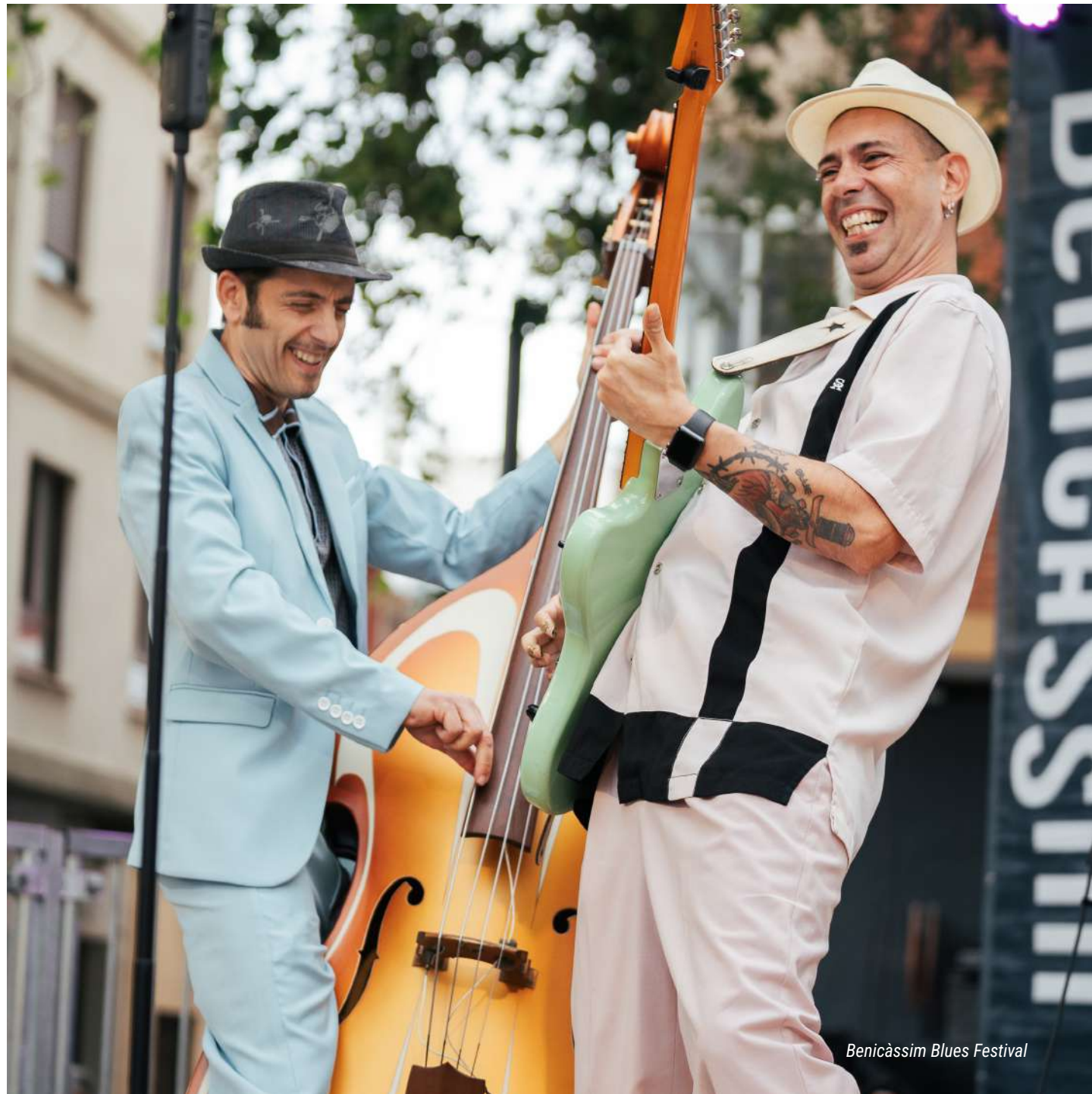
Benicàssim Blues Festival