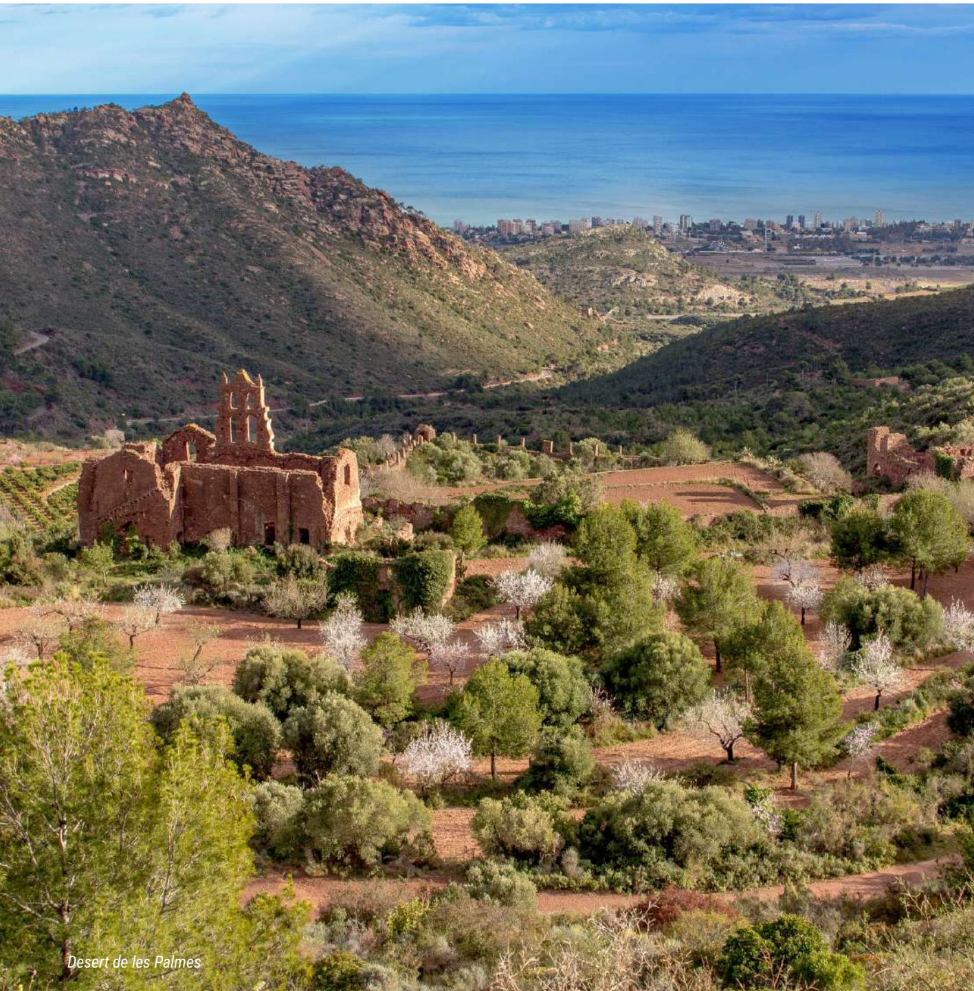
Desert de les Palmes