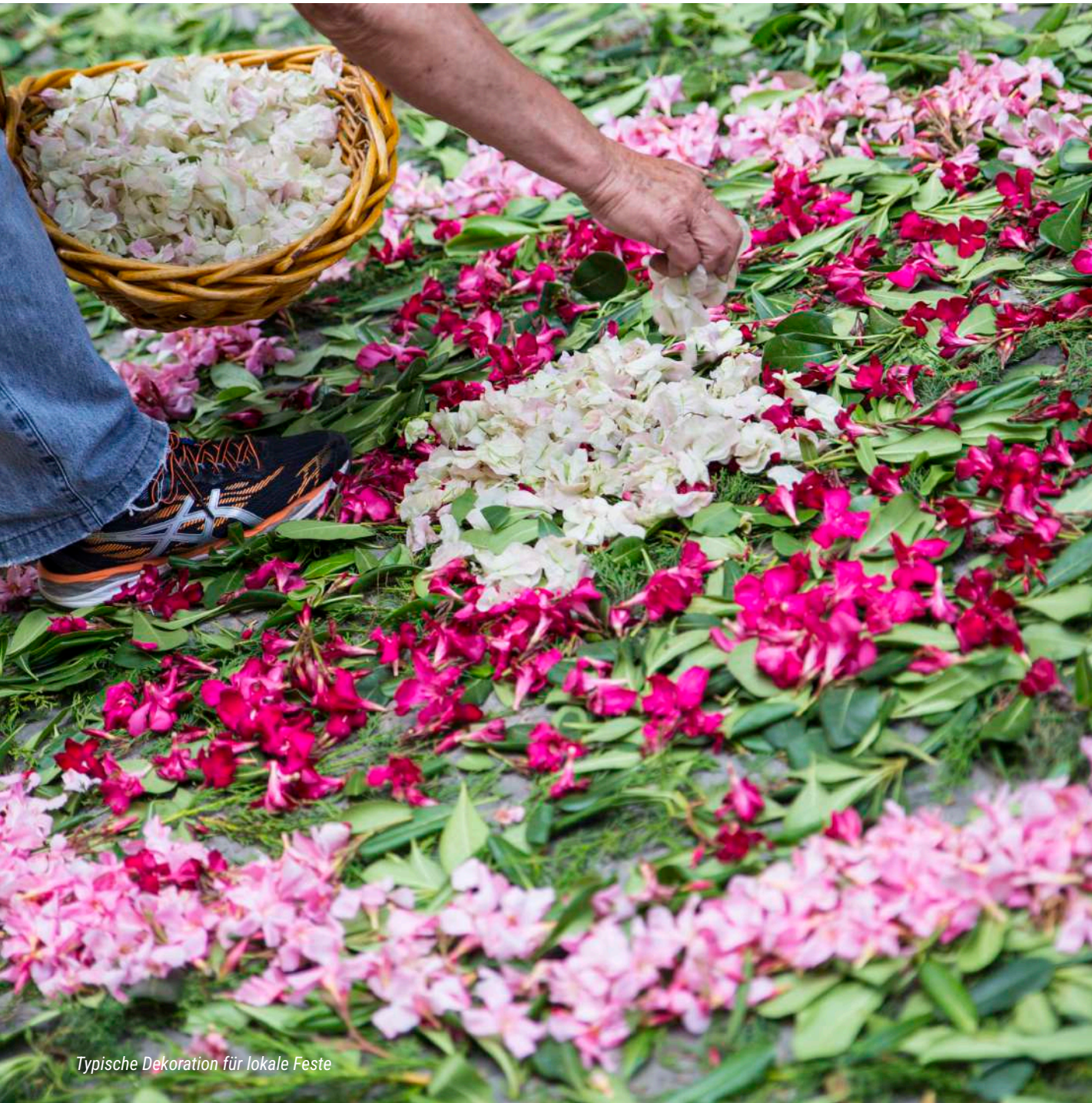
Typische Dekoration für lokale Feste