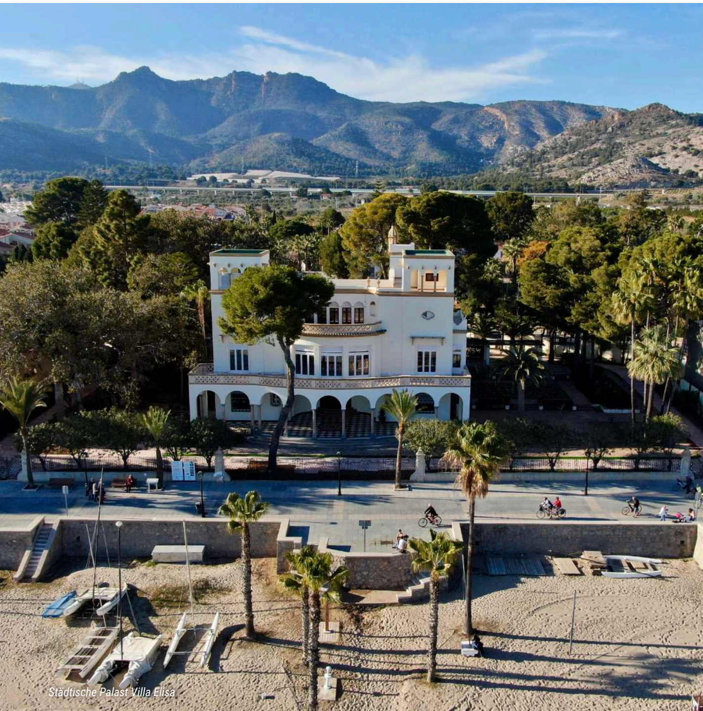
Städtische Palast Villa Elisa