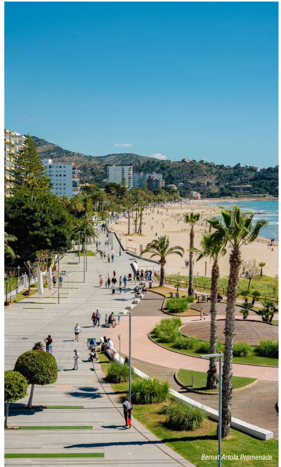
Bernat Artola Promenade