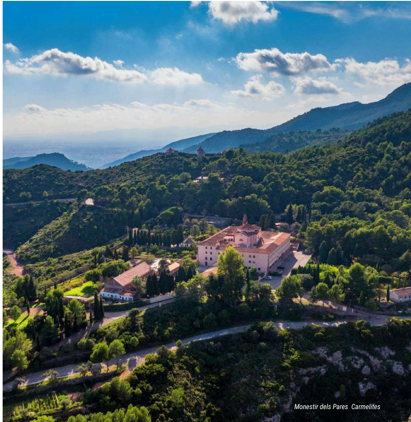
Monestir dels Pares Carmelites

Retir espiritual i història entre la naturalesa