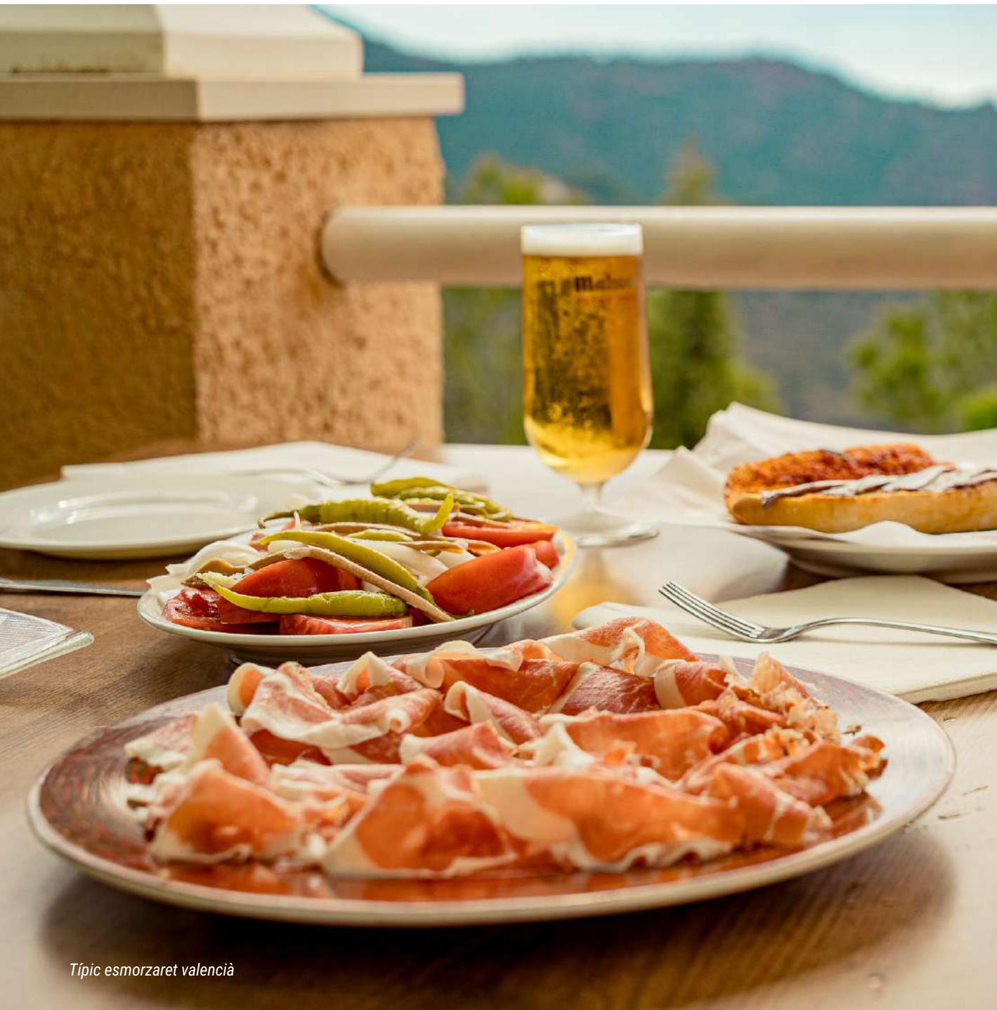
Típic esmorzaret valencià