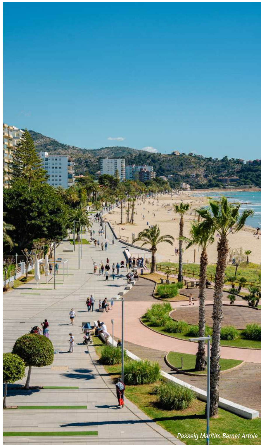
Passeig Marítim Bernat Artola