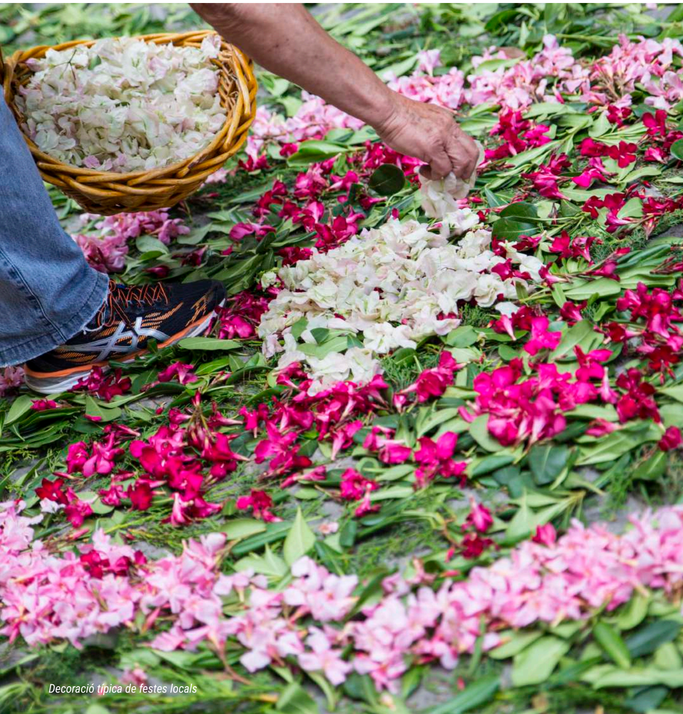
Decoració típica de festes locals