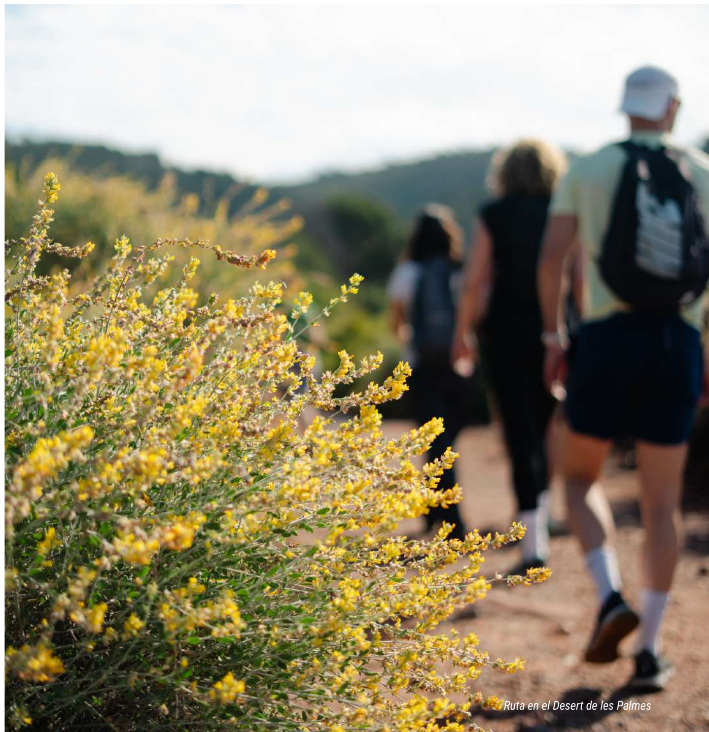
Ruta en el Desert de les Palmes