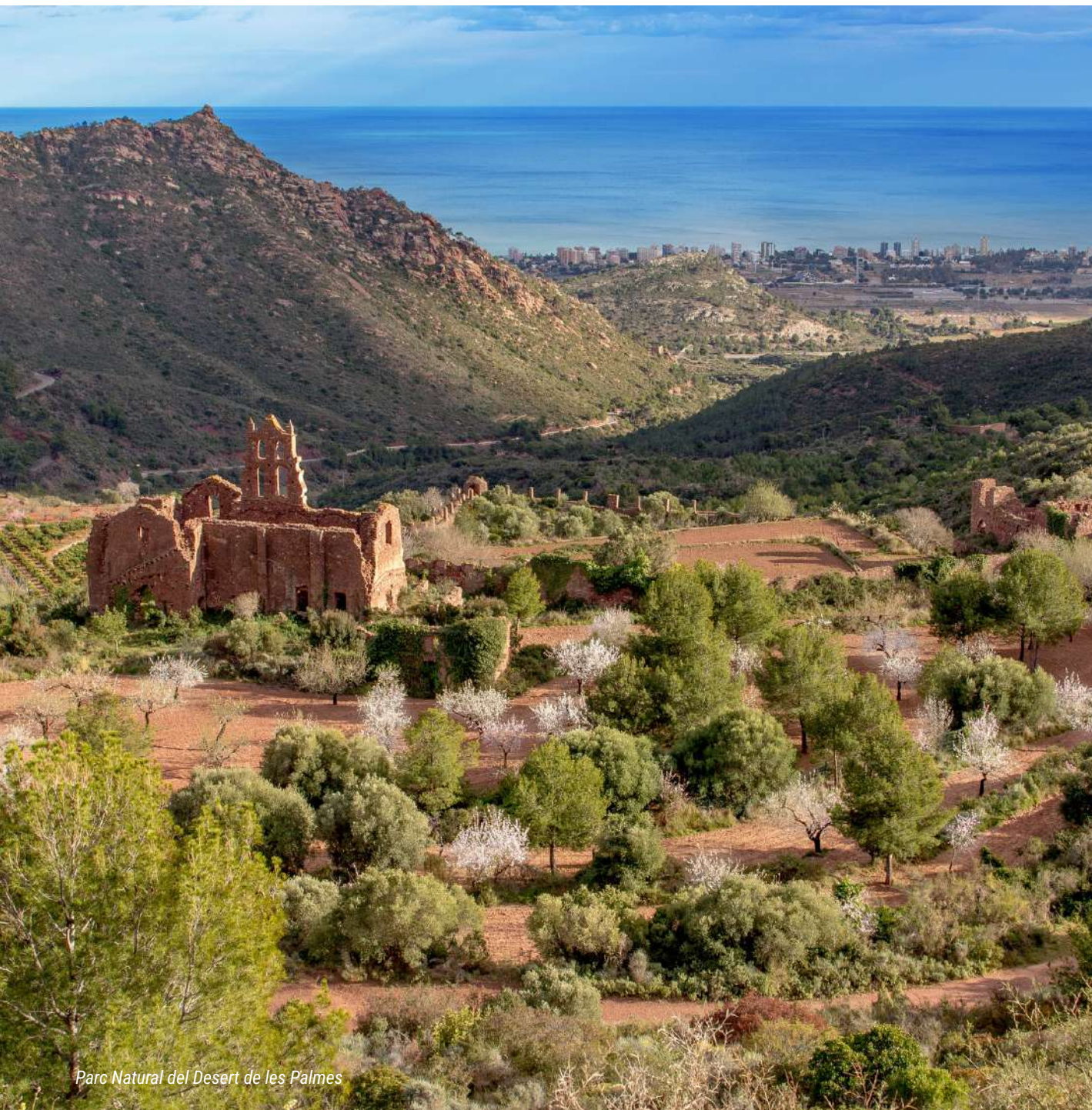
Parc Natural del Desert de les Palmes