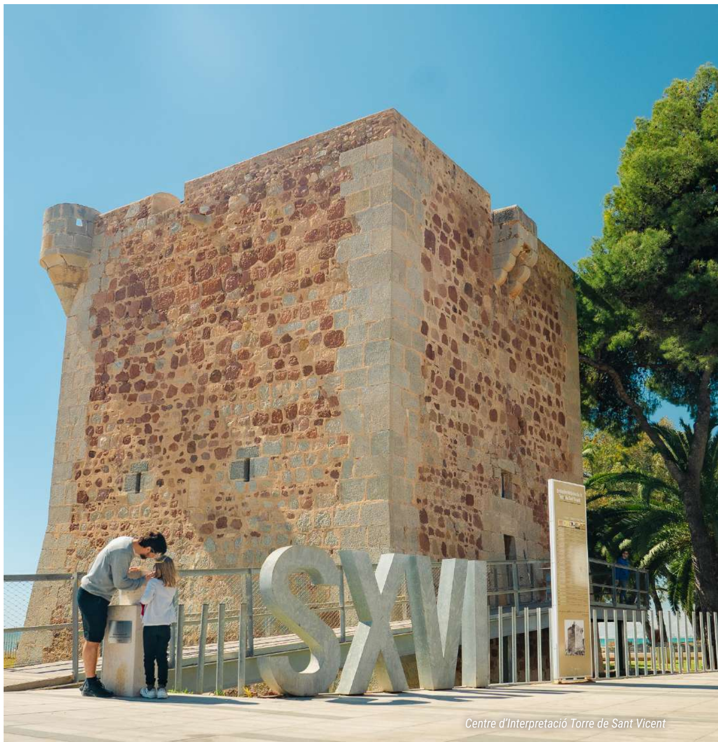
Centre d'Interpretació Torre de Sant Vicent

Torre de Sant Vicent: testimoni del passat